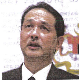
Tan Sri Dr Noor Hisham Abdullah