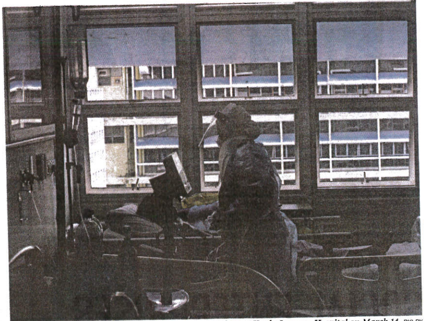
A medical worker tending to a Category 3 Covid-19 patient at Kuala Lumpur Hospital on March 14.

"Out of the 42 categories 3, 4 and 5 cases, 15 have taken the booster dose, 14 have completed two doses and 13 were either unvaccinated or received only one